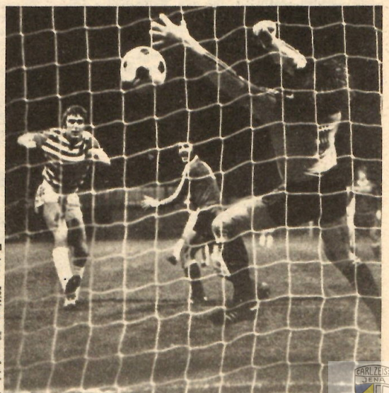
Der wichtige Kopfball Schnuphases zum 1 : 0.