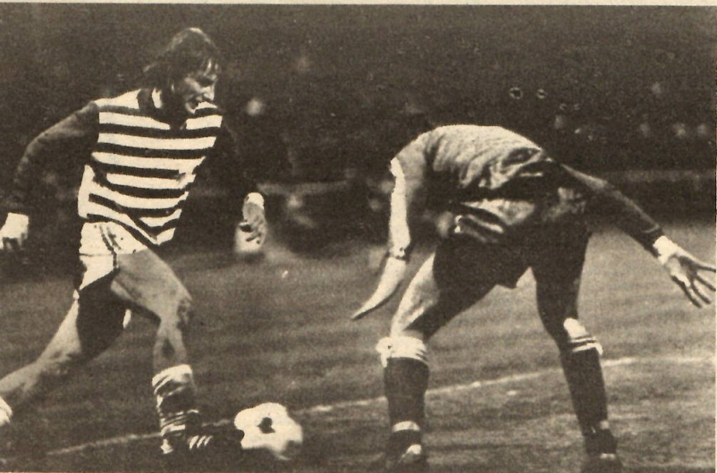
Der Jenaer Töpfer versucht, Poel auszuspielen.