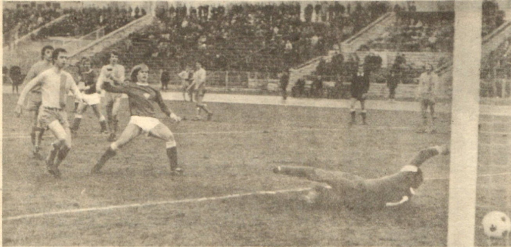
Das 4:0 fällt für den Berliner FC Dynamo: Niediger überwindet den sich vergeblich wertenden Lok-Torsteher Stötzner. Verteidiger Roth (links) kann den BFC-Stürmer nicht mehr stören.